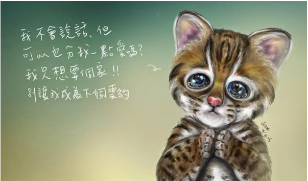
圖片取自社團法人中華亞洲環境生態護育交流協會網站 守護石虎：石虎的故事