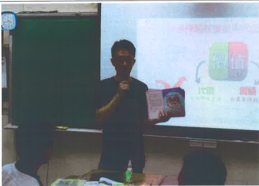
照片說明：國中專輔教師以簡報及影片，結合學習單內容向學生說明性平議題。