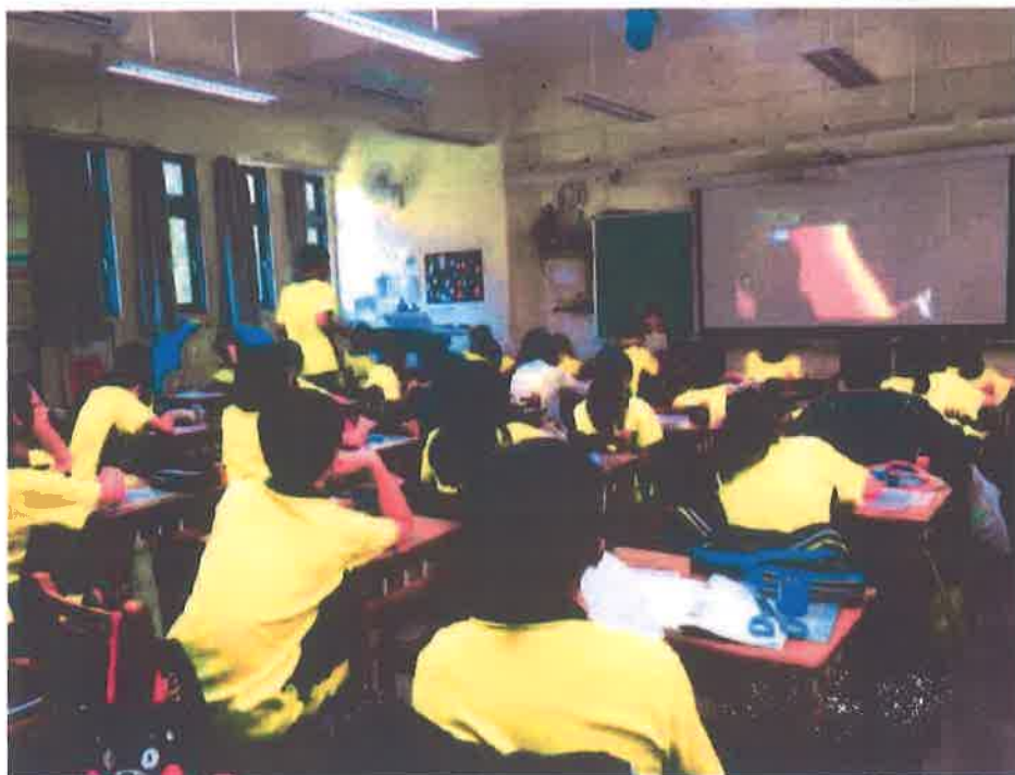
照片說明：同學們認真觀看影片！