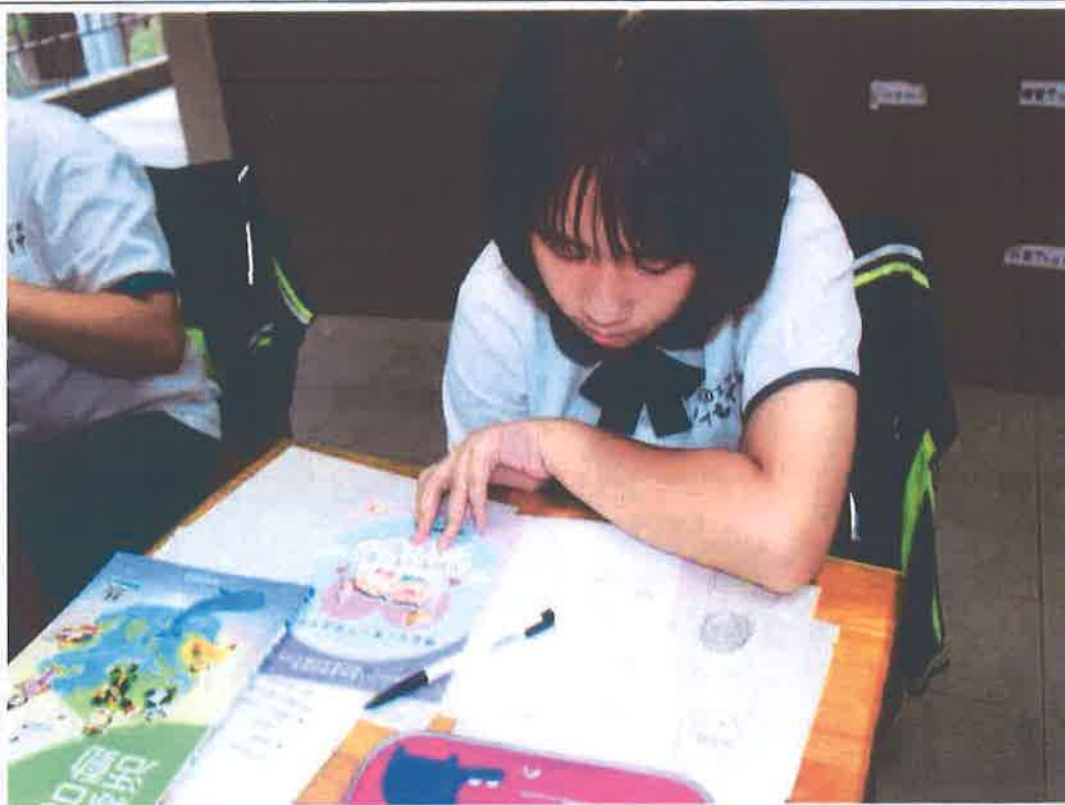
照片說明：學生認真思考學習單內容，並表達自己對性平議題的看法。