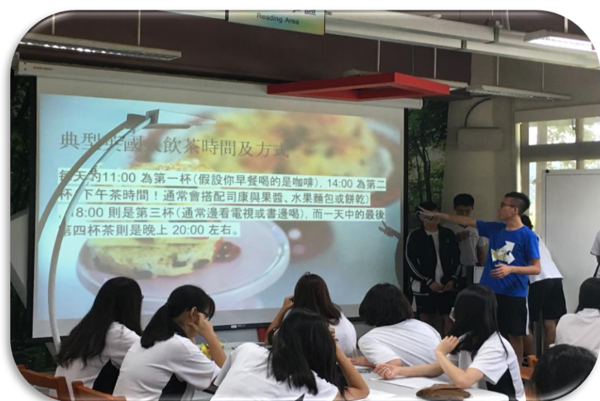
世界茶文化專題報告