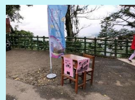
鳶山健行行前佈置