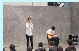
國中部有溫度的一首歌