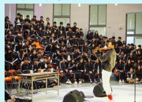
高中部有溫度的一首歌