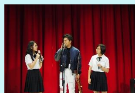
高中部有溫度的一首歌