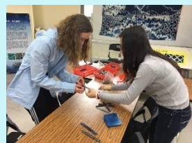
加拿大生科手作體驗