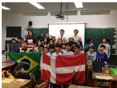
外籍生與班級學生合影