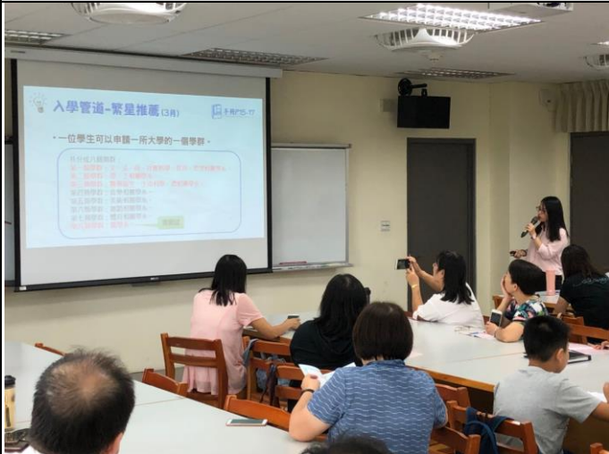
107 學年度親職講座-108 考招