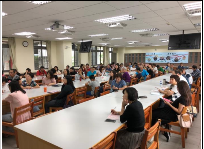
107 學年度親職講座-108 考招