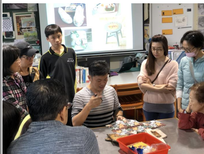
107 學年度家庭手作課程-蝶古巴特 親子一同聽講師講解作法