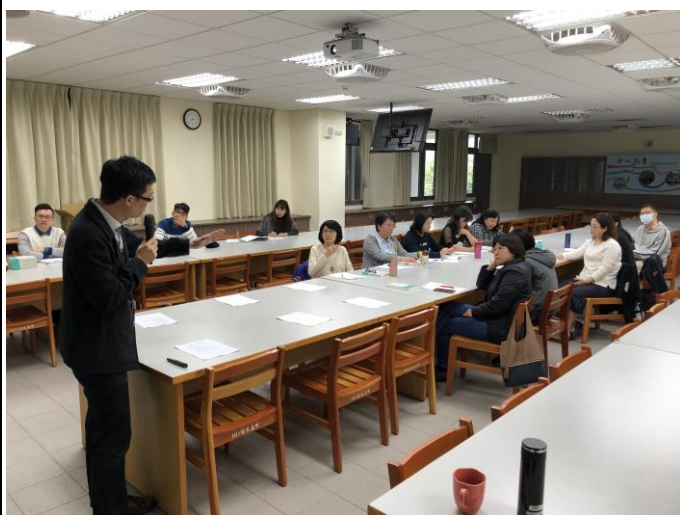
107 學年度家庭讀書會-2 主題：談家庭內的生命系統