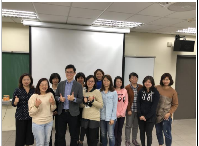
107 學年度家庭讀書會-3 全體參與學員與講師合照