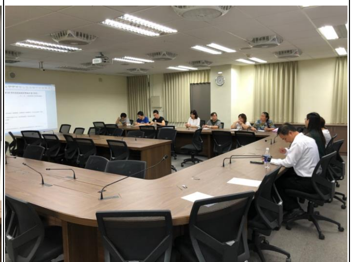
107 學年度家庭教育工作委員會 提案說明及討論