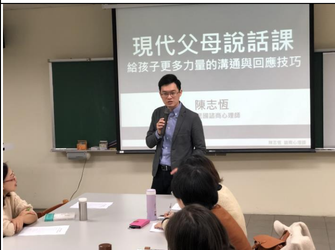
107 學年度家庭讀書會-3 主題：父母如何與孩子溝通與回應