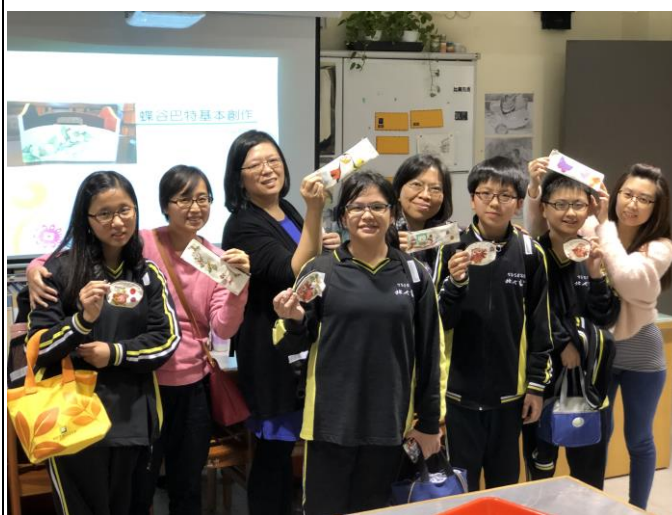
107 學年度家庭讀書會-蝶古巴特 學生從父母手中收到蝶谷巴特比待