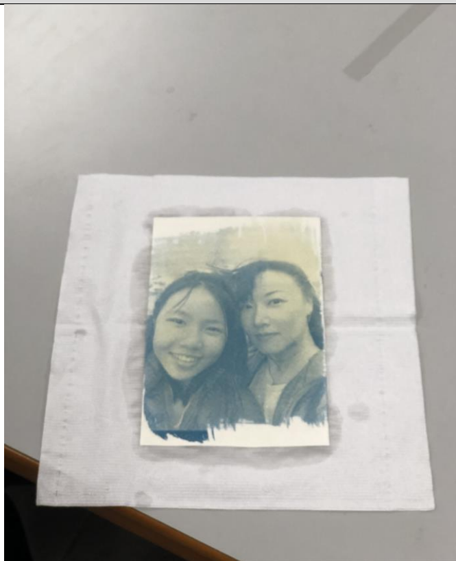
107 學年度家庭手作課程-藍晒照片 藍晒照片成品