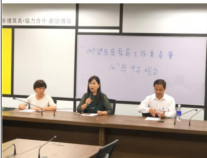
107 學年度家庭教育工作委員會 進行家庭教育工作推動討論