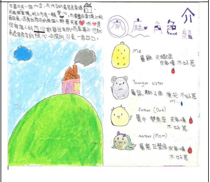
107 學年度校內家庭小書甄選優良