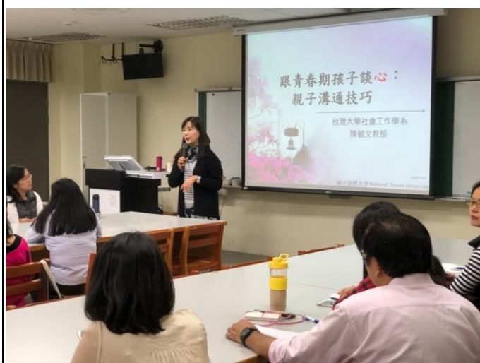
107 學年度親職講座-陪青春孩子談心 校長親自主持開場活動並全程參與