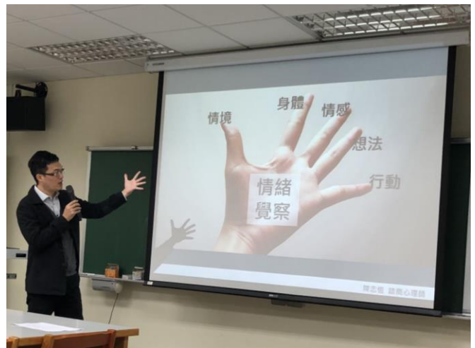
107 學年度家庭讀書會-2 主題：談自我情緒覺察技巧