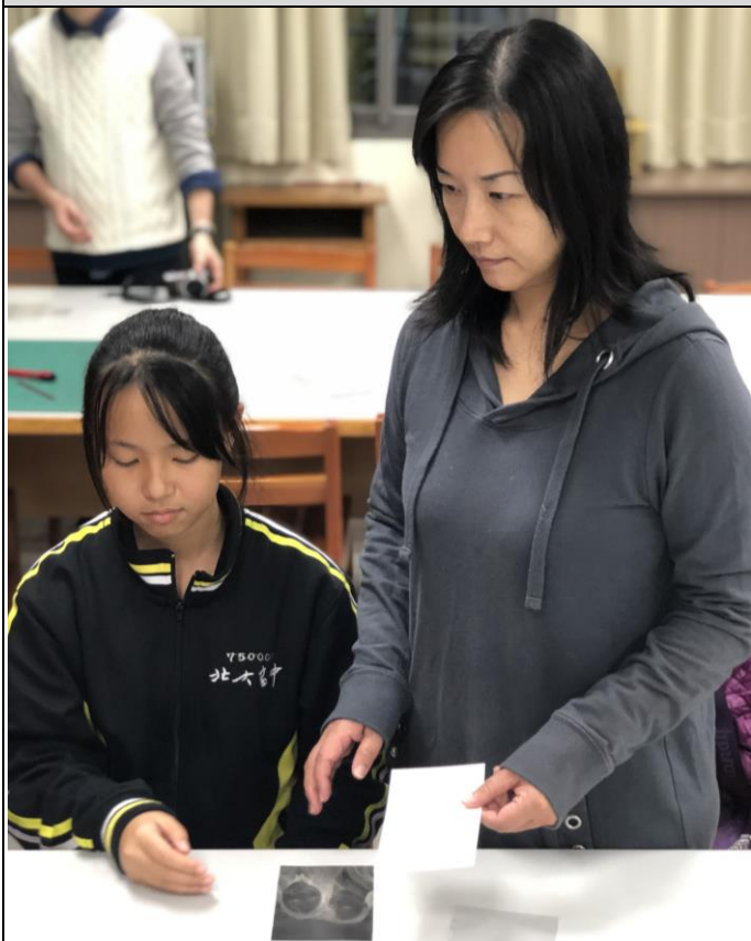
107 學年度家庭手作課程-藍晒照片 母親與孩子一同將照片製作成藍晒圖