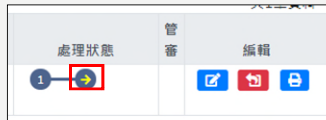
初審通過，進入複審