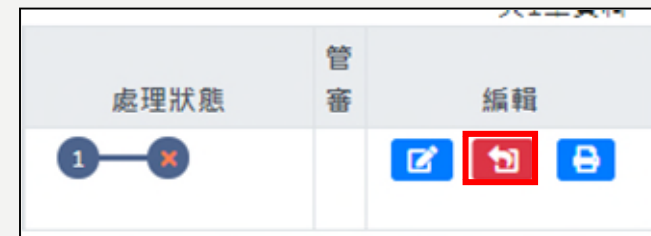
學生修改後再次提交計畫